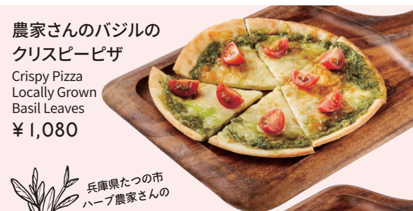
農家さんのバジルの クリスピーピザ Crispy Pizza Locally Grown Basil Leaves ¥ 1,080