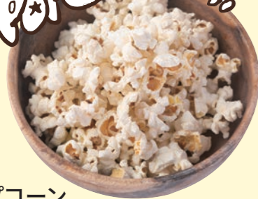
ポップコーン Popcorn ¥ 120