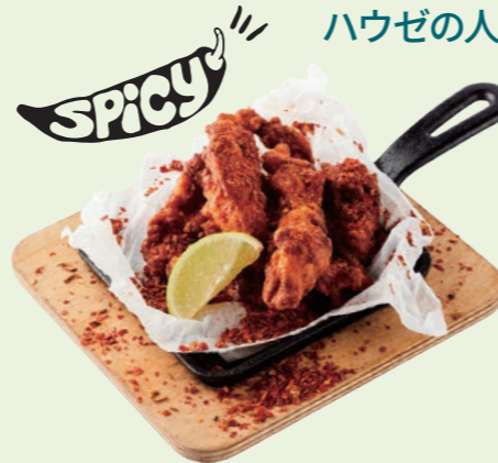
※お子様はご注意ください ビール屋さん仕込みの クリスピーチキン with ライム&ホットスパイス Beer Battered Crispy Fried Chicken with Lime and Hot Spice ¥ 890