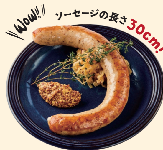
炭火焼き 30 cm! 生ポークロングソーセージ 30cm! Jumbo Pork Sausage ¥ 1,080