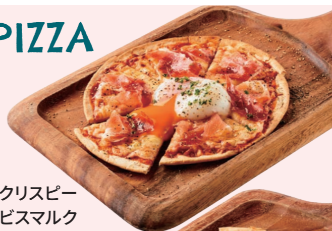
クリスピー ビスマルク Crispy Bismark Pizza ¥ 1,180