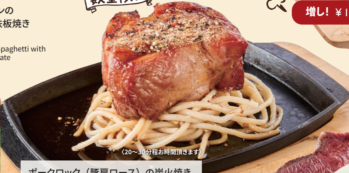
ポークロック (豚肩ロース) の炭火焼き Howzit Grilled Pork Rock 300g ¥ 980 450g ¥ 1,980