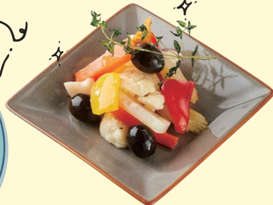
自家製お野菜のピクルス&オリーブ Homemade Pickled Vegetables and olive ¥ 480