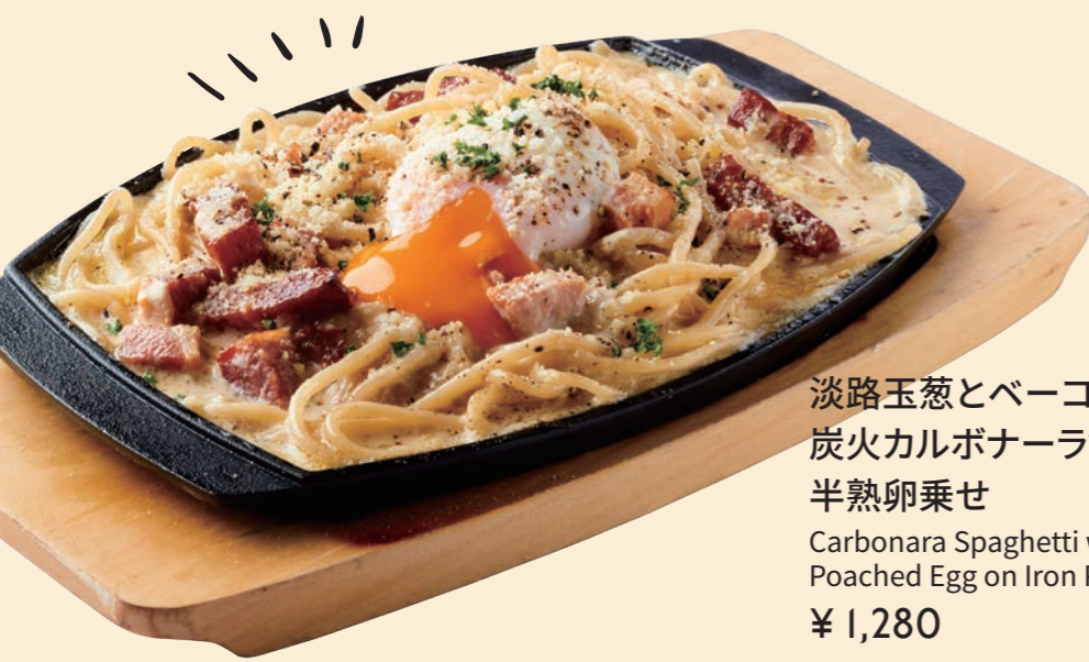
淡路玉葱とベーコンの 炭火カルボナーラ鉄板焼き 半熟卵乗せ Carbonara Spaghetti with Poached Egg on Iron Plate ¥ 1,280