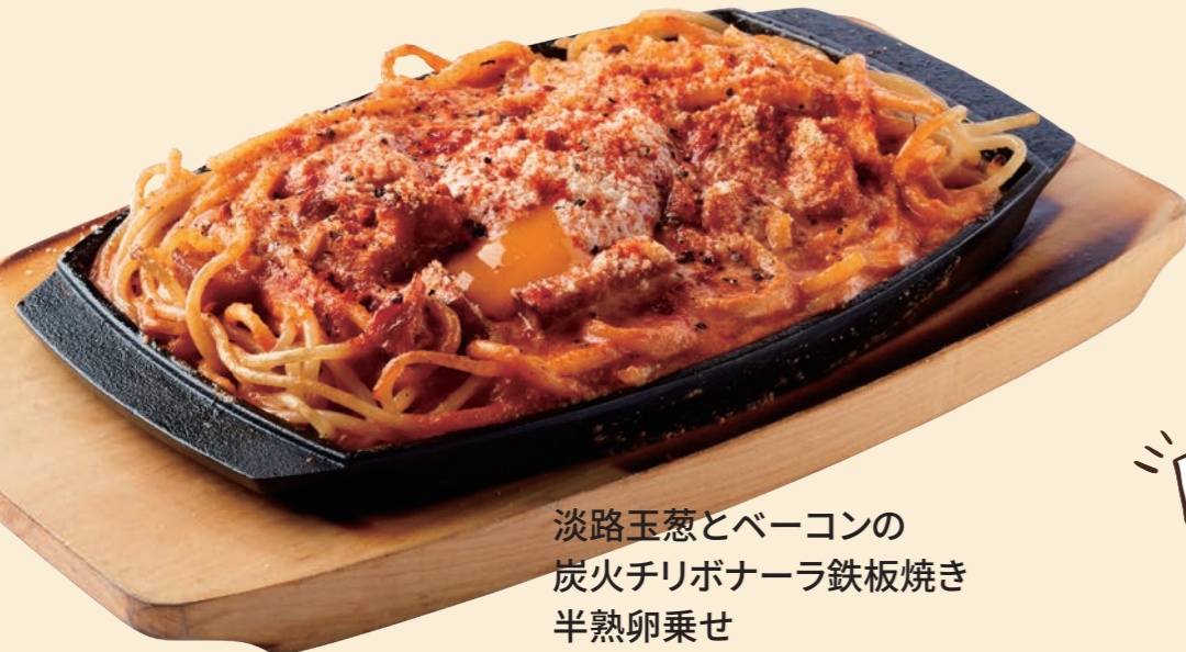
淡路玉葱とベーコンの 炭火チリボナーラ鉄板焼き 半熟卵乗せ Spicy Chili Carbonara Spaghetti with Poached Egg on Iron Plate ¥ 1,380