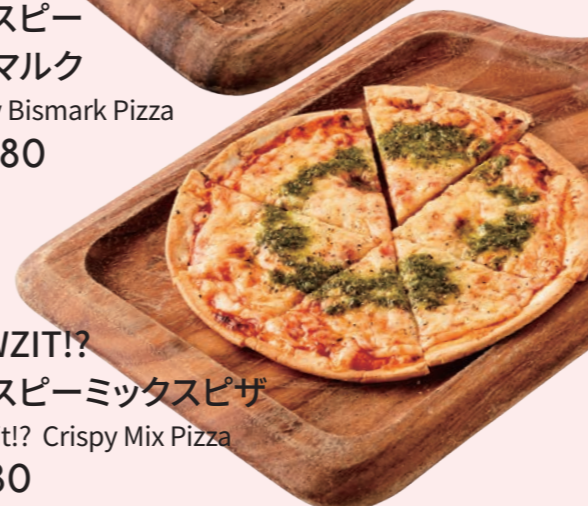
HOWZIT!? クリスピーミックスピザ Howzit!?! Crispy Mix Pizza ¥ 980