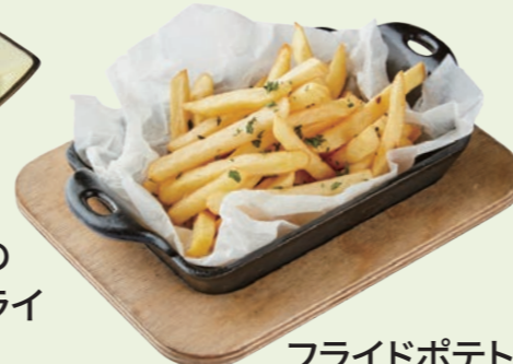
フライドポテト Fried Potato ¥ 570