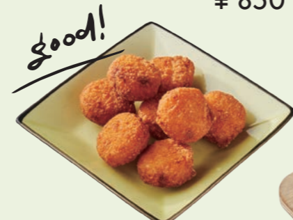
チェダー&モッツァレラの ころころチーズポテトフライ Fried Cheddar Cheese and Mozarella Potato ¥ 750