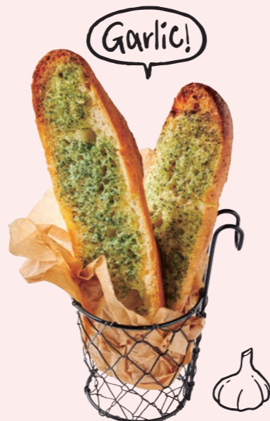
名物! ロングガーリックトースト Howzit Original Long Garlic Toast ¥ 880