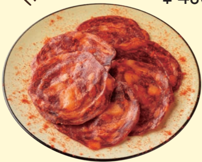
スペイン産ピリ辛サラミ “チョリソー” Chorizo Salami from Spain ¥ 450