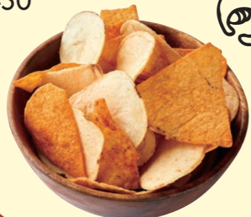
スパイシーチリトルティーヤ &ポテトチップス Spicy Chili Tortilla and Potato Chips ¥ 480