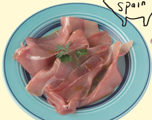
スペイン産ハムハモンセラノ Jamon Serrano from Spain ¥ 630