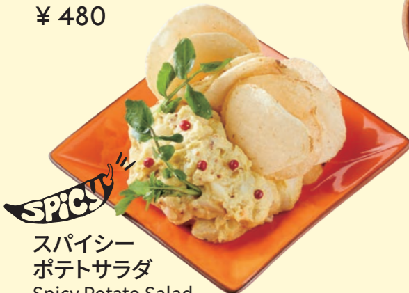
スパイシー ポテトサラダ Spicy Potato Salad ¥ 480