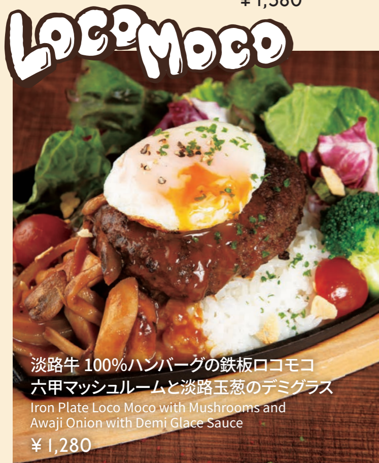
淡路牛 100%ハンバーグの鉄板ロコモコ 六甲マッシュルームと淡路玉葱のデミグラス Iron Plate Loco Moco with Mushrooms and Awaji Onion with Demi Glace Sauce ¥ 1,280