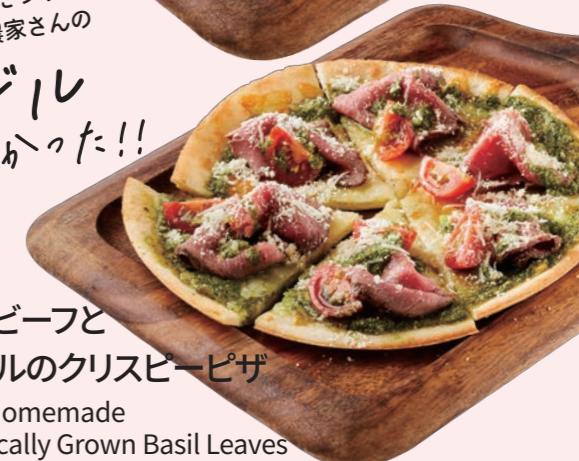
自家製ローストビーフと 農家さんのバジルのクリスピーピザ Crispy Pizza with Homemade Roast Beef and Locally Grown Basil Leaves ¥ 1,280