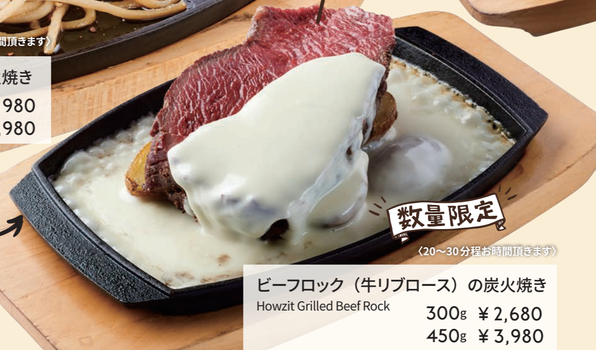
ビーフロック (牛リブロース) の炭火焼き Howzit Grilled Beef Rock 300g ¥ 2,680 450g ¥ 3,980