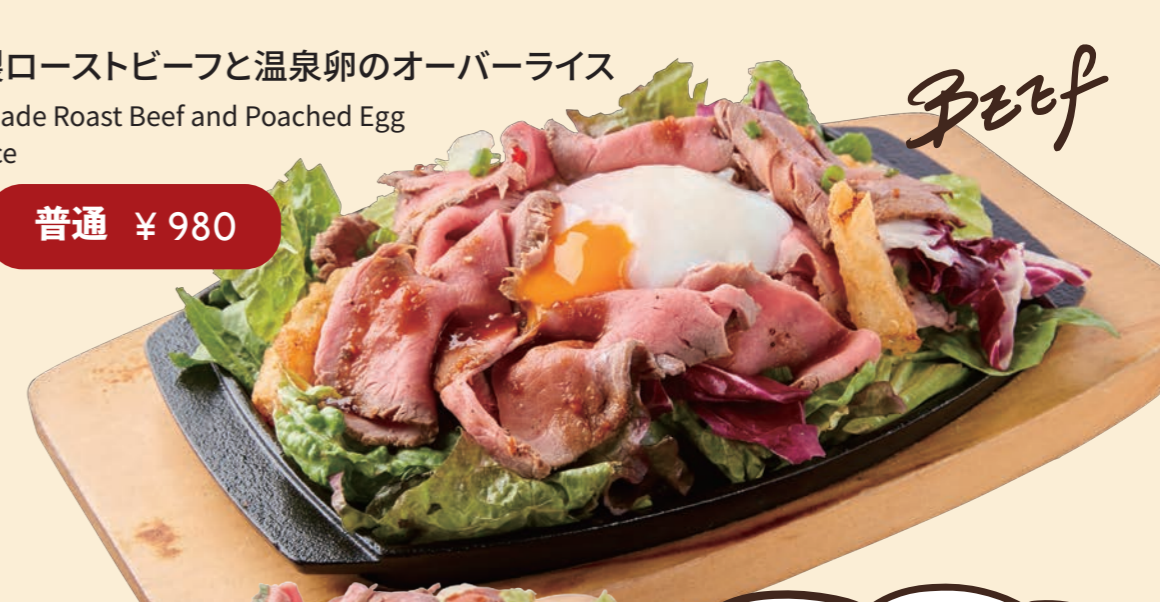
自家製ローストビーフと温泉卵のオーバーライス Homemade Roast Beef and Poached Egg Over Rice