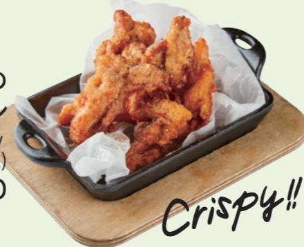
ビール屋さん仕込みの クリスピーチキン Beer Battered Crispy Fried Chicken (Original) ¥ 850