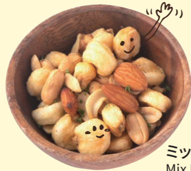
ミックスナッツ Mix Nuts ¥ 480