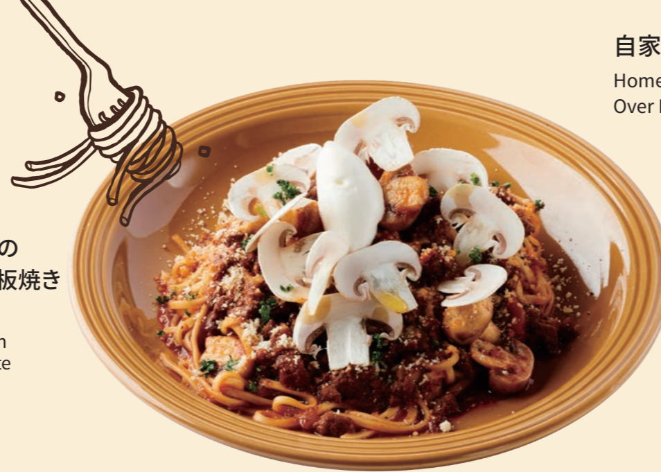
フレッシュ六甲マッシュルームと自家製ミートソースの 生パスタ マスカルポーネチーズ Homemade Meat Sauce Pasta with Fresh Rokko Mushroom and Mascarpone Cheese ¥ 1,330